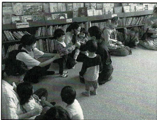
「赤ちゃんおはなし会」